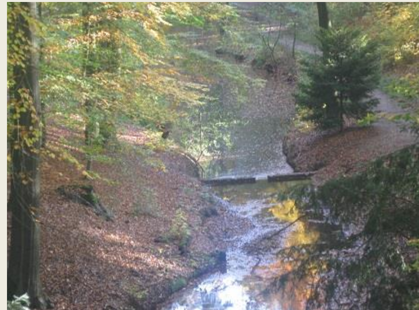
De bron (sprengkop) van de Oorsprongbeek

Bovenaan de Oorsprongbeek bevinden zich 3 bronnen die in de middeleeuwen door de mens zijn uitgegraven. Het water dat hier ontspringt, stroomt met een ongekend verval van 35 meter richting Neder-Rijn. Vroeger dreef de beek twee kruitmolens en twee papiermolens aan. In 2008 is het waterstelsel geheel gerestaureerd. De lemen bekleding van de beek; die ervoor zorgt dat het water niet in de grond wegzakt, was in de loop der tijd op meerdere plaatsen lek geraakt.